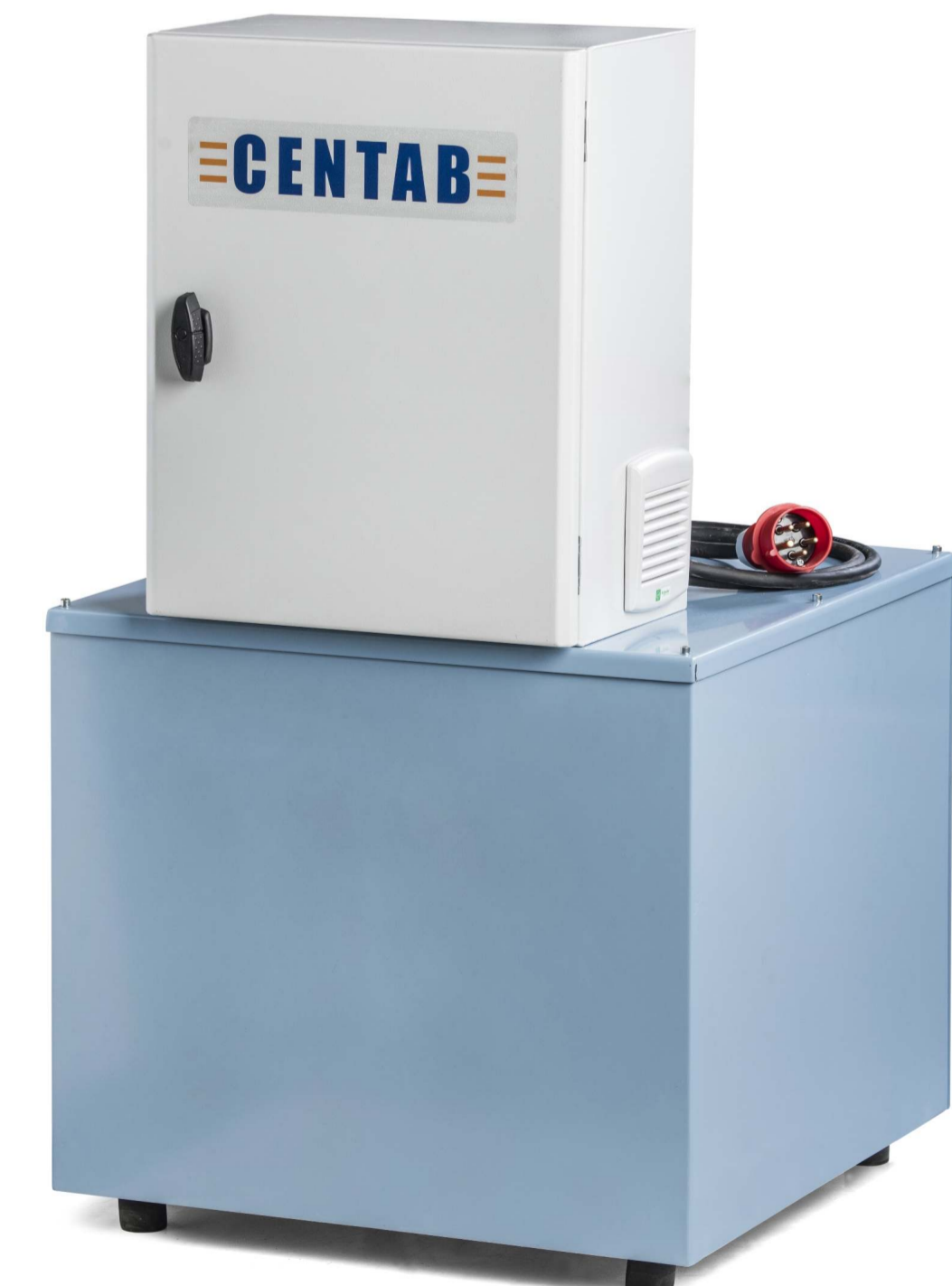
Fritstående ventilator med påbygget el-styring, anvendes sammen med filteranlæg.

KONTAKT OS I DAG FOR MULIGHEDER OG LØSNINGER RING TIL OS PÅ TELEFON 70 22 44 40