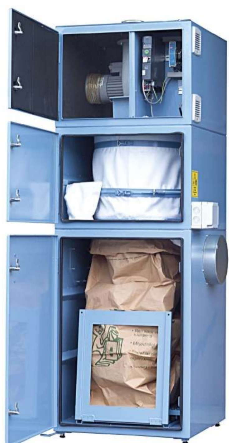
Kompakt spånsugeanlæg med integreret ventilator, filter, styring og opsamlingsseæk.

FlexAir er importør og distributør af CENTAB's produkter i Danmark. CENTAB produceres i Sverige og er kendetegnet ved høj kvalitet til fornuftige priser.