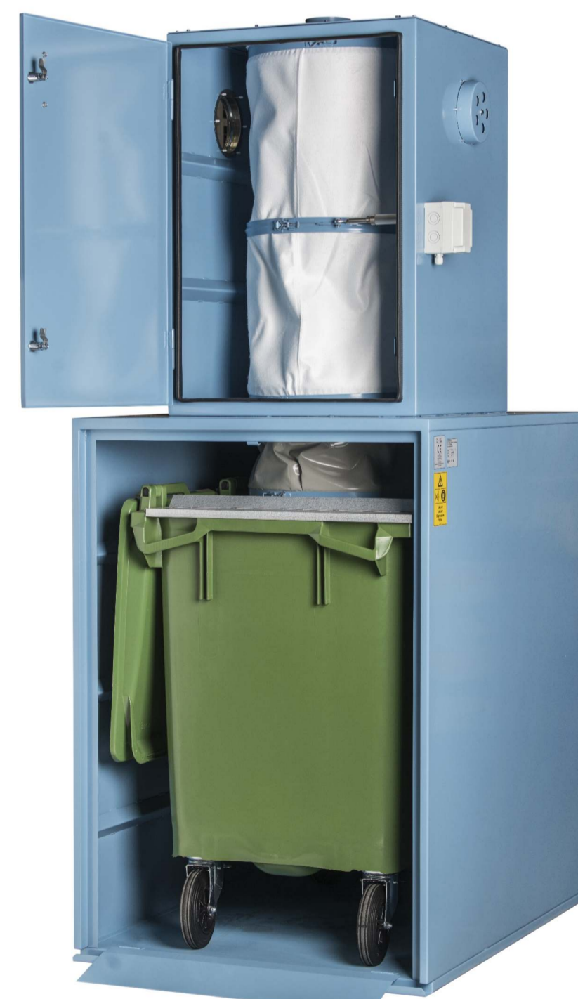
Spånsugefilter med ekstra stor opsamlingskapacitet på 600 ltr.